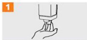
1 Deposite en la palma de la mano una cantidad de jabón suficiente para cubrir todas las superficies de las manos;