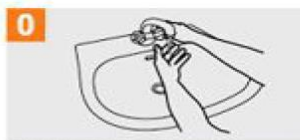
0 Mójese las manos con agua;

0 Duración de todo el procedimiento: 40-60 segundos