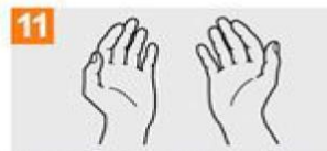
11 Sus manos son seguras.