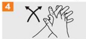
4 Frótese las palmas de las manos entre sí, con los dedos entrelazados;