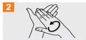
2 Frótese las palmas de las manos entre sí;