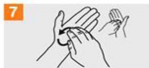
7 Frótese la punta de los dedos de la mano derecha contra la palma de la mano izquierda, haciendo un movimiento de rotación y viceversa;