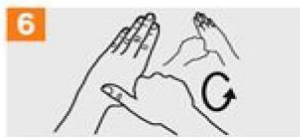
6 Frótese con un movimiento de rotación el pulgar izquierdo, atrapándolo con la palma de la mano derecha y viceversa;